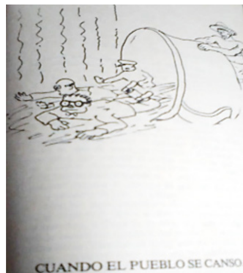
Caricatura de Don Toribio de la Tetera donde se observa al pueblo representado por un obrero o campesino tirando la bacinica con Marentes y sus allegados.