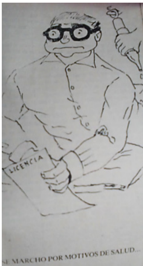
Fotografía tomada de la novela Don Toribio de la Tetera, representando el momento en que Don Toribio pide licencia y renuncia a la gubernatura.