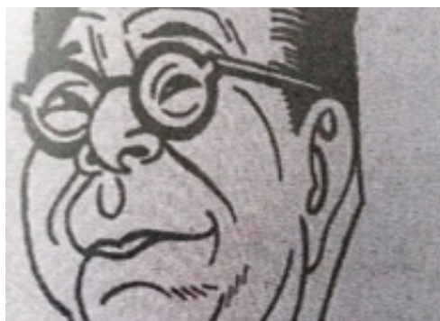
Caricatura de la Revista La Crítica , donde se representa de una manera pícaro y burlesca la imagen del Gobernador Tomás Marentes Miranda.

candidato oficial del PRI al gobierno del estado de Yucatán, y, por otro lado, a todo el gabinete elegido por este mismo para que lo acompañara en la administración estatal. Las caricaturas realizadas por el equipo editorial de La Crítica ridiculizaban al régimen mostrando a Marentes y a su gabinete como personas poco capaces de llevar en buen puerto al Estado, e incluso acusándolos del desastre del campo yucateco y la quiebra de Henequeneros de Yucatán (HY), 6 así como de la crisis en otros productos como el aguacate. ( La Crítica , 1952, 24-25). A continuación, se exponen algunas fotografías de las caricaturas de esta revista que fueron hechas contra el Marentismo.