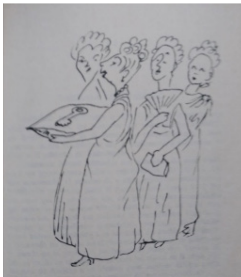
Caricatura tomada de la novela Don Toribio de la Tetera, donde muestran unas damas de sociedad en el baile de aniversario del gobernador.