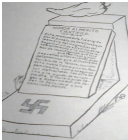
Caricatura tomada de la novela Don Toribio de la Tetera, donde se ve representada la muerte y caída del régimen Marentista.

tintas ilustraciones ridiculizan al régimen estatal (Alpuche, 2020:1) tal como se muestra en los ejemplos que he seleccionado. En la caricatura donde Don Toribio se encuentra humillado y agarrado de un poste, simboliza la forma en la que veían al mandatario estatal. Tanto en las imágenes de las damas como el de la bacinica tirada por un campesino que simboliza al pueblo, se hace referencia a la forma tan despectiva en que los yucatecos veían al gobernador, aparte de la élite que lo apoyaba conformada por los descendientes de la Casta Divina y algunos miembros de la comunidad sirio-libaneses. Por su parte, las caricaturas donde aparecen unos perros orinando una placa alusiva a Tomás Marentes Miranda, así como en la que se puede ver a Don Toribio de la Tetera en el momento en que pide licencia y renuncia a la gubernatura, y una donde se ve representada la muerte y caída del régimen Marentista, hacen alusión al final del Marentismo y, por ende, de este período tan controversial de la historia yucateca.