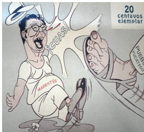
Caricatura tomada de la Revista La Crítica , de 1953, donde representa de una manera burlesca el momento de la caída de Tomás Marentes Miranda, como gobernador y por lo tanto el final del Marentismo.

En estas dos caricaturas de la revista La Crítica se puede observar que en la primera se representa de una manera pícaro y burlesca la imagen del Gobernador Tomás Marentes Miranda, y en la segunda –de 1953–, se representa de una manera burlesca el momento de la caída de Tomás Marentes Miranda como gobernador y, por lo tanto, el final del Marentismo. En esta última, cuya imagen deja en claro la oposición y la crítica a la administración Marentista, se puede interpretar que el pie representa al pueblo y a la sociedad yucateca, quienes lograron que la federación removiera