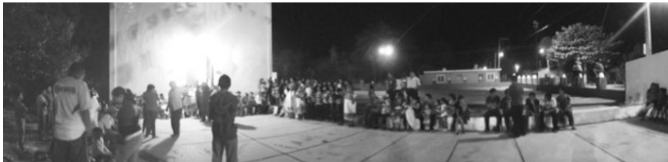
Representación de Los Abrahames .

La representación de "Los Abrahames" es de las más importantes,